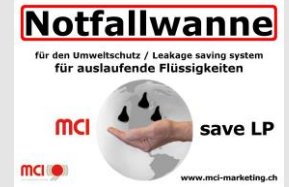
Einsatz: MCI SAVE LP Notfallwanne in Wasserschutzzone