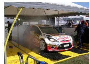
Hohe Belastbarkeit: Einsatz bei ADAC Rallye