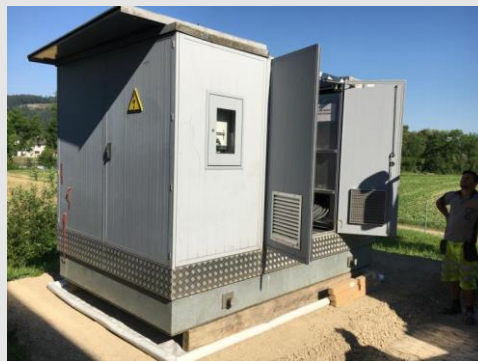
Bodenschutz beim Einsatz von mobilen Trafostationen