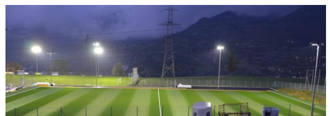
Fußball- Haupt- und Trainingsplätze