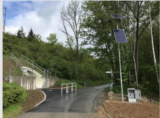
Installationsbeispiel: Autarke Beleuchtung einer Bahnunterführung/Fuß-Radweg