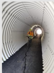
Sicherheit für Radfahrer