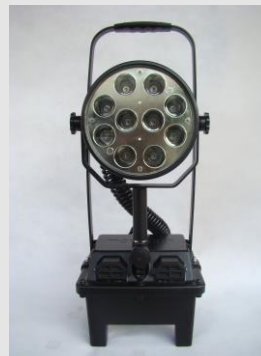
MCI BW 3210 Arbeitslicht