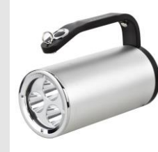
MCI BW 7101