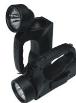
MCI BW 6210