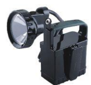
MCI BW 6200 E