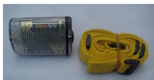
MCI BW 4100