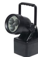
MCI BW 6610