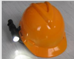
MCI BW 7300

Ex geschützte Bereiche, EX gefährdete Bereiche Strassentunnel und Tunnelbaustellen Lagerhallen, Raffinerien, Ölfelder, Tankstellen Petrochemie, Chemiebetrieb, Munitionsfabriken Feuerwerkskörperproduktion usw. im Umfeld von explosiven Produkten, Staub, Feststoffen, Gasen Mobile Beleuchtung mit wenig Energieverbrauch für Feuerwehr Polizei und Hilfsdienste