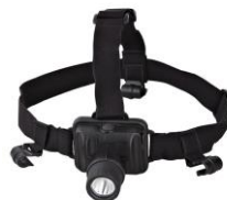
MCI BW 6310