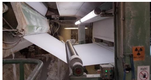
MCI-LED-NS98-Kompaktröhre für sicheres und bestes Licht am Arbeitsplatz