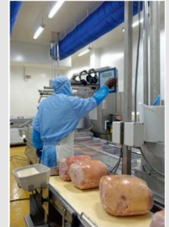
MCI-LED-NS98-Kompaktröhre mit Notbeleuchtungsfunktion für Lebensmittelproduktion, Lagerhäuser usw.