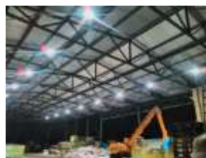
Industrie- und Werkhallen