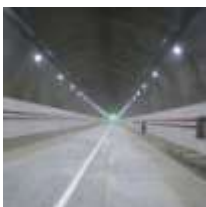
Strassen- u. Versorgungstunnel