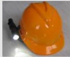
MCI BW 7300

Ex geschützte Bereiche, EX gefährdete Bereiche Strassentunnel und Tunnelbaustellen Lagerhallen, Raffinerien, Ölfelder, Tankstellen Petrochemie, Chemiebetrieb, Munitionsfabriken Feuerwerkskörperproduktion usw. im Umfeld von explosiven Produkten, Staub, Feststoffen, Gasen Mobile Beleuchtung mit wenig Energieverbrauch für Feuerwehr Polizei und Hilfsdienste