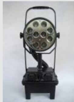
MCI BW 3210 Arbeitslicht