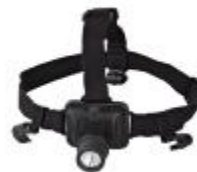
MCI BW 6310