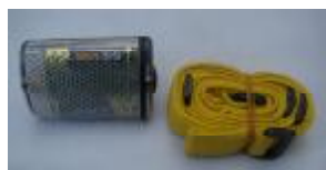
MCI BW 4100