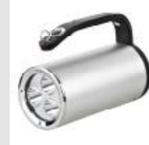
MCI BW 7101