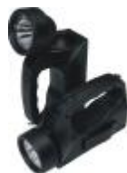
MCI BW 6210