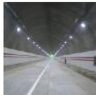
Straßen- u. Versorgungstunnel