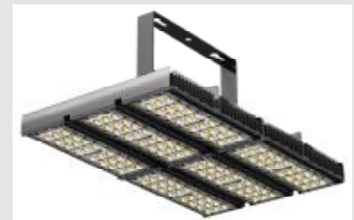
und Hallen aller Art