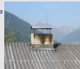
Folgeschäden innerhalb und ausserhalb des Kamins